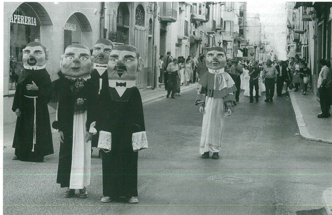
Els Caps Grossos a la Processó del Corpus