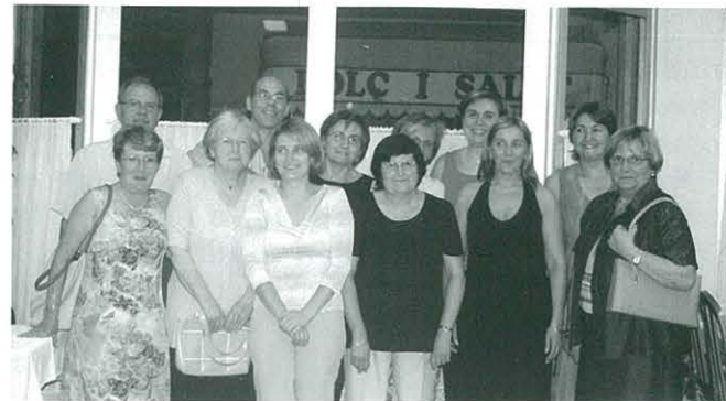
Sopar-cloenda del curset de català

Ja hem finalitzat el segon curset de català, i com l'any passat ho vam celebrar amb un bon sopar.