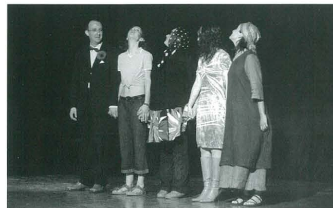
Representació de l'obra "OBSESIÓN POR WOODY ALLEN"

El passat diumenge dia 8 de juny, i dintre de les XI Jornades de Cultura Catalana, el Centre Cultural Recreatiu, seguint la trajectòria dels últims anys, va celebrar el Dia del Soci. Per celebrar l'acte tal com cal, van ser convidats tots els socis de l'entitat per gaudir d'una tarda de teatre. Per a l'ocasió es va escollir l'obra "OBSESIÓN POR WOODY ALLEN" que va ser representada per l'Escola de Teatre Diabolus, de la ciutat veïna de Vinaròs.