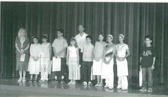
Lliurament de premis del XXXII Concurs Literari Sant Jordi