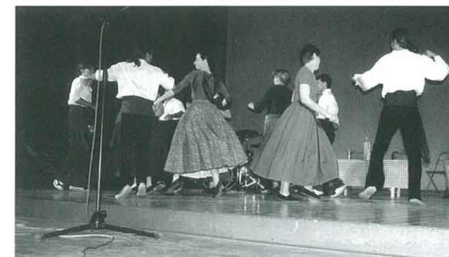
EL TEMPS A TEMPS. Música i dansa tradicional catalana

També hem participat els dies 14 i 21 de juny, en l'espectacle El Temps a Temps , de música i dansa tradicional catalana, de l'Aula de Música Tradicional i Popular, que es va celebrar a Santes Creus i al Teatre Municipal d'Ulldecona, posant la il·luminació i el so.