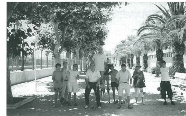
Curset de teatre al carrer i malabars

El passat dia 21 vam fer un curset de teatre al carrer i malabars, en el que ens ho vam passar molt bé pujant en xanques i fent volar tot tipus d'objectes.