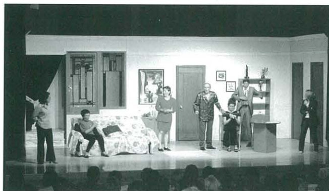
Representació de l'obra "A l'armari i al llit al primer crit"

La nostra secció de teatre com sempre, no para, mentre ja es prepara l'obra que clausurarà les Jornades de Teatre d'aquest any, continua portant el magnífic món de talia arreu de les nostres contrades. Aquesta volta, el nostre grup de teatre va desplaçar-se a Benicarló on van representar l'obra A l'armari i al llit al primer crit . El públic assistent va ser molt nombrós, el qual va quedar molt satisfet amb el bodevil que el grup del CCR els va representar. El grup escènic d'Ulldecona es va quedar molt satisfet amb la rebuda de l'afecionat de Benicarló.